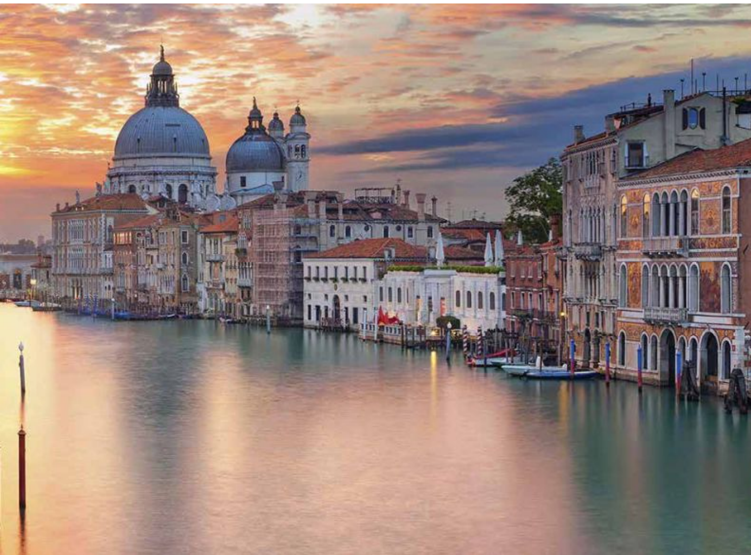
Рис. 5. Панорама Венеции