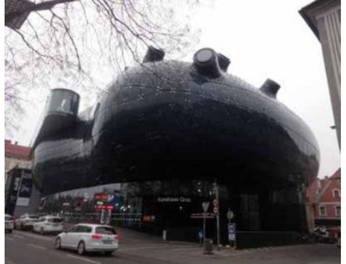
Рис.1. Музей современного искусства в г.Гратц, Австрия. (Арх –ры Питер Кук, Колин Фурье. «2003г.)

связанную с ростом многообразия процессов и функций, растущим товарным выбором». Резюмируя вышесказанное, можно предположить, что мир движется к созданию принципиально новой Постиндустриальной среды обитания – Среды Синтетической, социал-природной, которая, возможно, со временем, войдет на планете в зенит абсолюта.