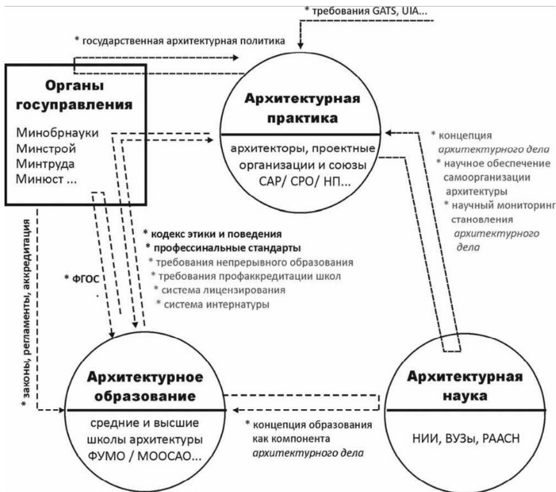
Рис. 2 – Ключевые компоненты и связи в системе архитектурного дела

специалиста с такими компетенциями, зачем, скажите, нужны пятилетние бакалавриаты и семилетние магистратуры?