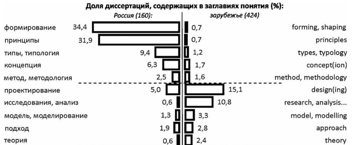
Рис.1. Общенаучная лексика в заглавиях диссертаций

Как уже отмечалось во второй статье серии, «формирование» выступает самым широко употребляемым понятием, ведущей отечественной стратегией обращения с предметом или объектом, это демонстрируют почти 35% диссертаций. А 20 работ из 160 озаглавлены «принципы формирования архитектуры...» таких-то зданий. В целом, сравнивая левую и правую части графика, видим, что российские диссертации, более чем зарубежные, ориентированы на: